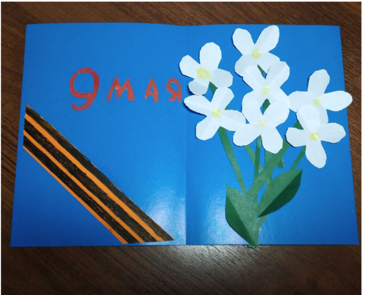
Михайлик Наташа (4 класс)