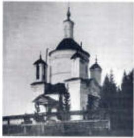
Храм Покрова Владивосток